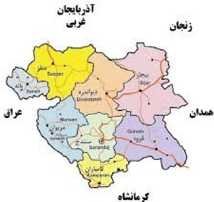
تصویر ۱- موقعیت شهرستان سقز در استان کردستان

سقز یکی از شهرستان‌های استان کردستان است که در شمال غربی مرکز استان یعنی سنندج و در فاصله ۱۸۷ کیلومتری آن واقع شده است و از شمال به آذربایجان غربی و شهر بوکان، از غرب به بانه و از جنوب به مریوان و از شرق به دیواندره محدود می‌گردد. بر اساس آمارهای سرشماری نفوس و مسکن در سال ۱۳۹۰ جمعیت شهرستان ۲۱۰۸۲۰ نفر است (فرمانداری شهرستان سقز).